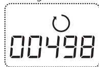
Forbrug i år